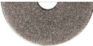
Антрацит металлик (Anthracite metallic)