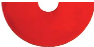
Красный металлик (Pure metal red)