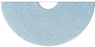
Серо-голубой (Ice blue)