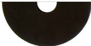
Черный матовый (Deep black matte)