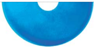
Синий металлик (Pure metal blue)