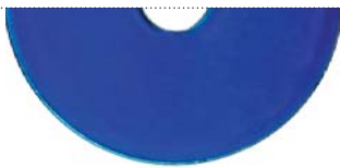
Морской синий (Dormant marine blue)