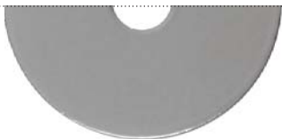
Серебряный бриллиант (Brilliant silver)