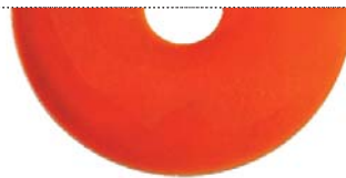
Бронзовый металлик (Pure metal bronze)