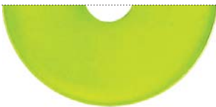
Зеленый металлик (Pure metal green)