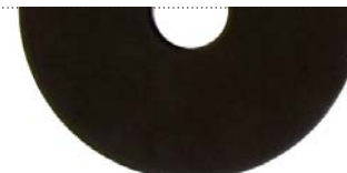
Черный (Jet black RAL 9005)