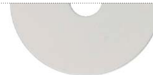
Белый перламутровый (White pearl)