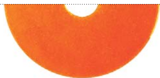
Оранжевый перламутровый (Sparkle light orange)