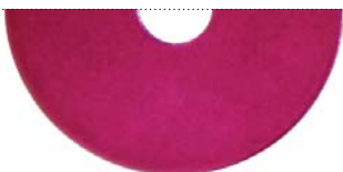
Малиновый перламутровый (Dormant Vinho Sparkle)