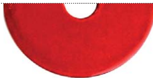
Красный перламутровый (Candy red)