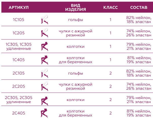
ТАБЛИЦА АРТИКУЛОВ И СОСТАВА ИЗДЕЛИЙ